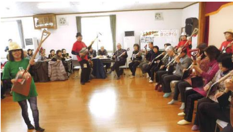
同新年会での演奏発表のようす（体験教室も）