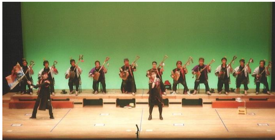
ステージでの発表