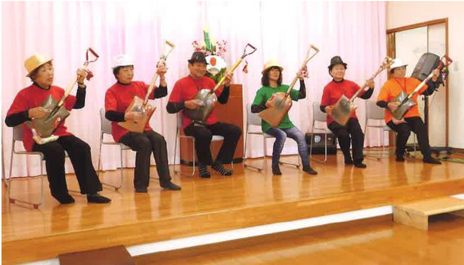
苫小牧市内の町内会新年会での演奏発表のようす（H30年1月）