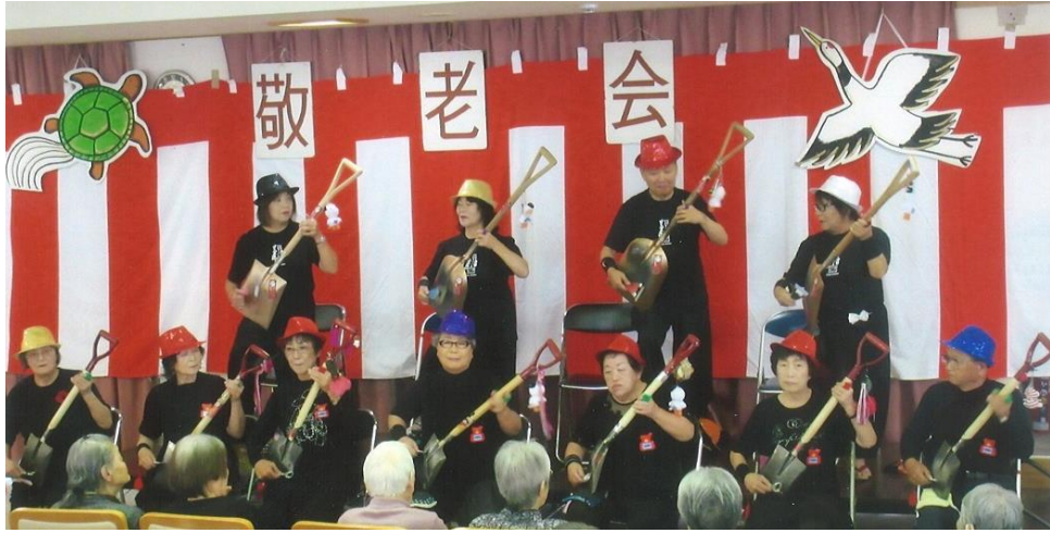
敬老会での発表② (H30年10月)