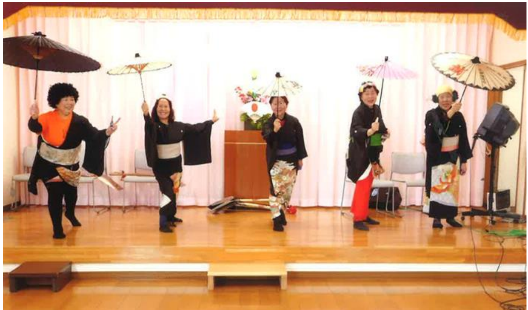
同新年会での演奏発表のようす