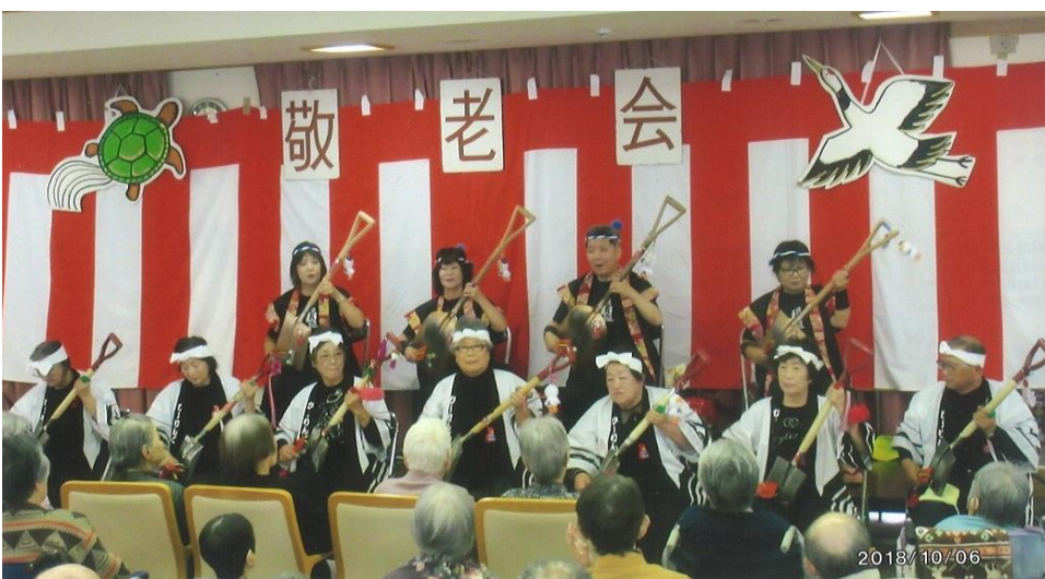
敬老会での演奏①（H30年10月）