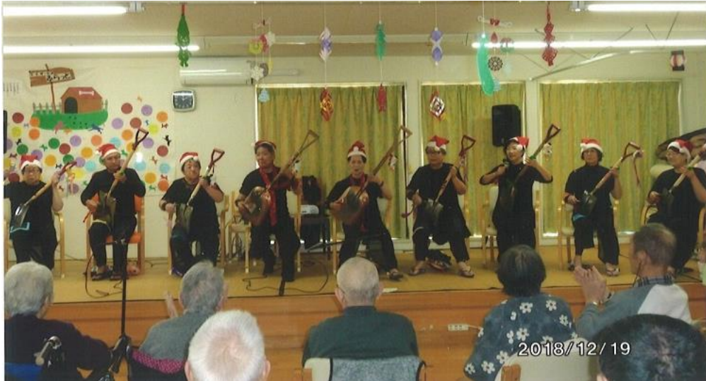
クリスマス会での演奏発表（H30年12月）